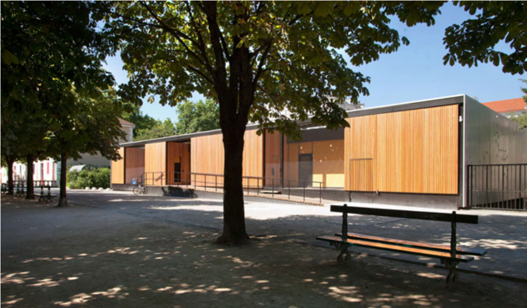
TRAITEMENT CARRELETS SUR BOITES ENCADRANT 3 LOGGIAS crédits photo : -