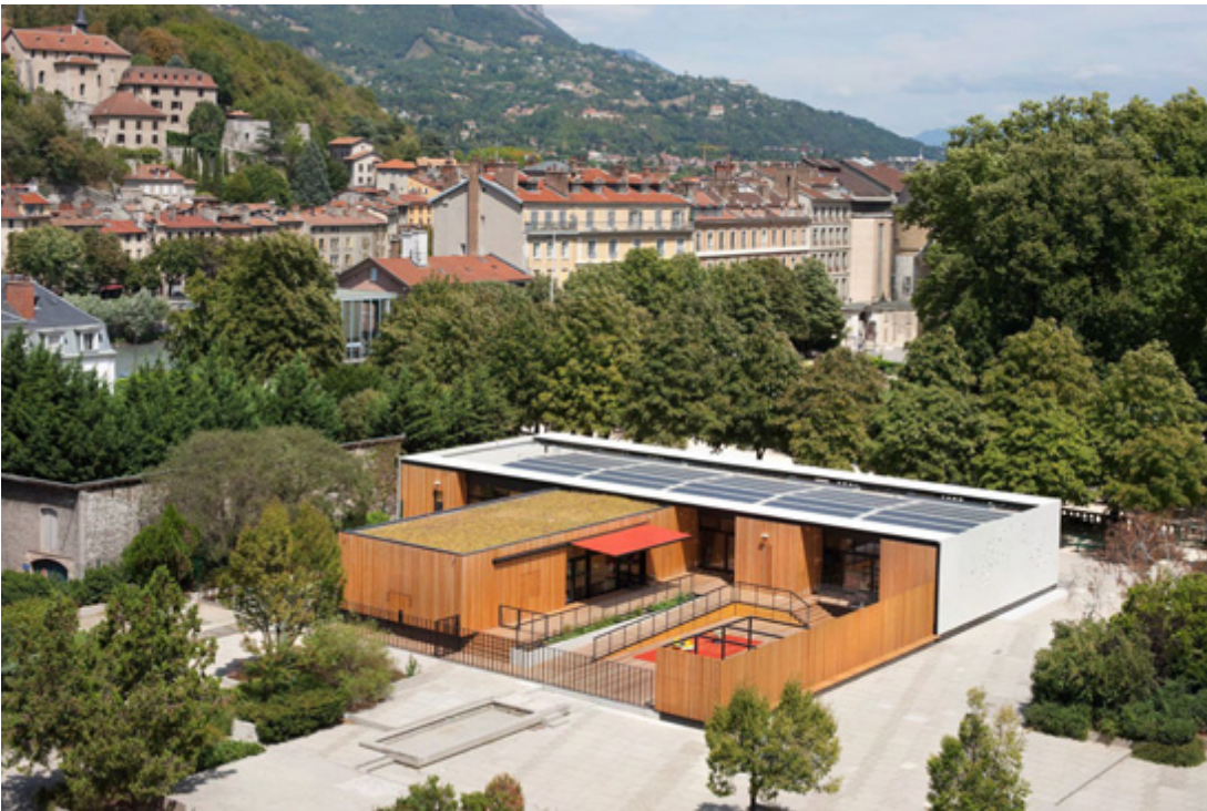
VUE D'ENSEMBLE TRAITEMENT 5ème FACADE MEMBRANE PV ET VEGETALISATION crédits photo : -