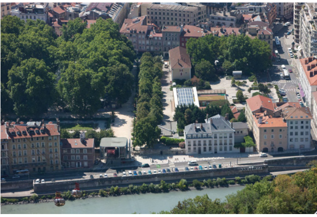
VUE D'ENSEMBLE DEPUIS LE TELEPHERIQUE TOURISTIQUE BASTILLE crédits photo : -