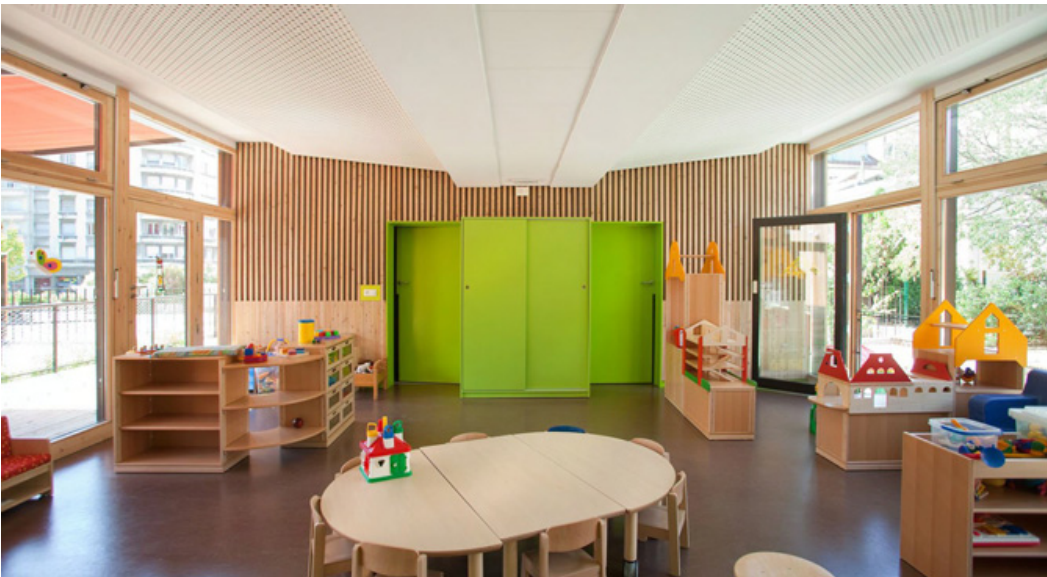
INTERIEUR - TRAITEMENT ACOUSTIQUE