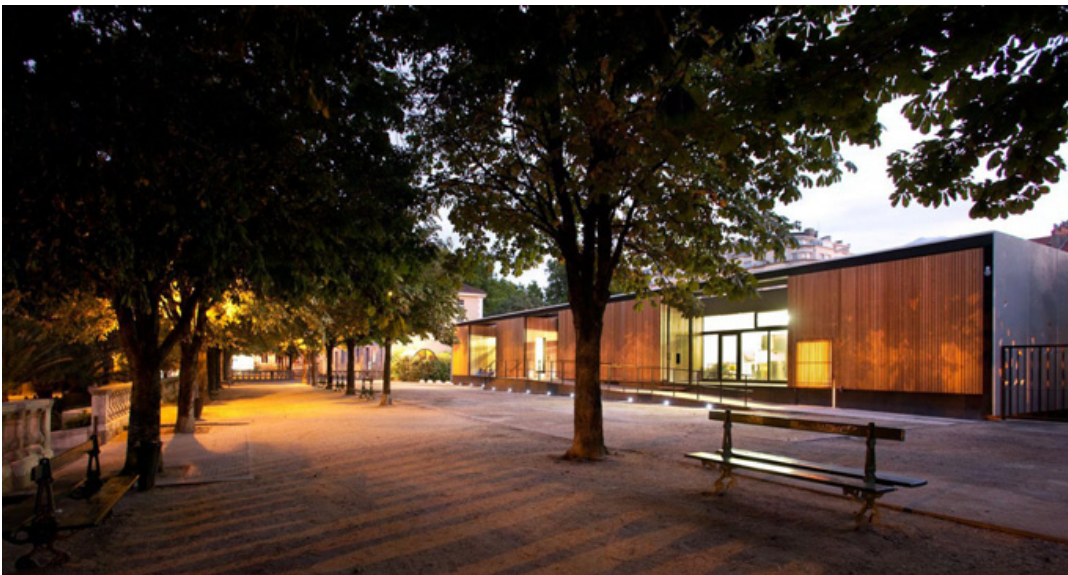
EXT NUIT SUR JARDIN DE VILLE