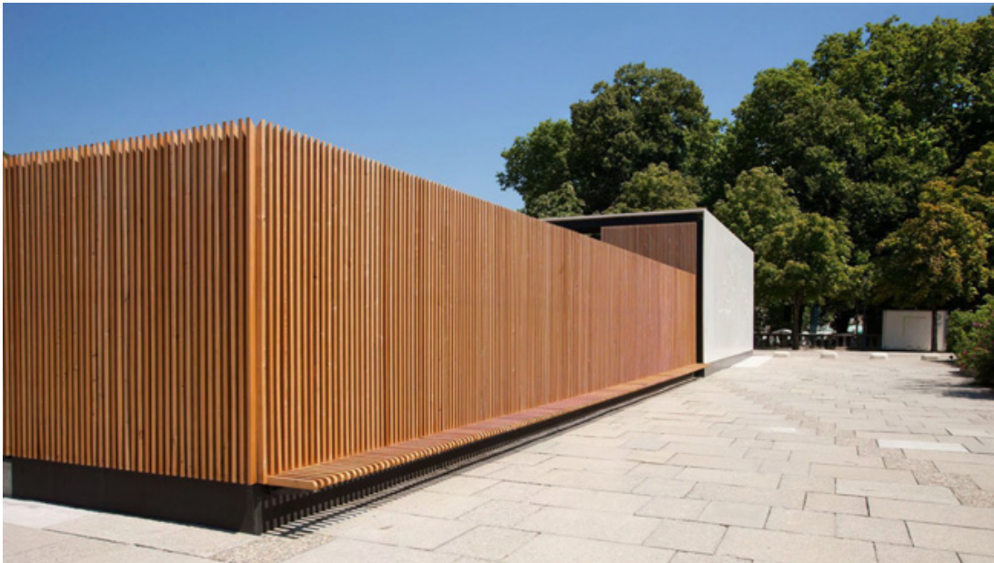
DETAIL BANC crédits photo : -