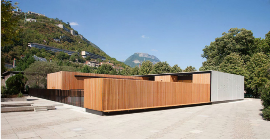
TRAITEMENT MUR SUD OMBRIERE ET BANC