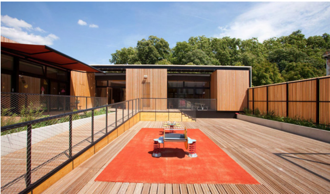
AMENAGEMENT EXT COUR SUD crédits photo : -