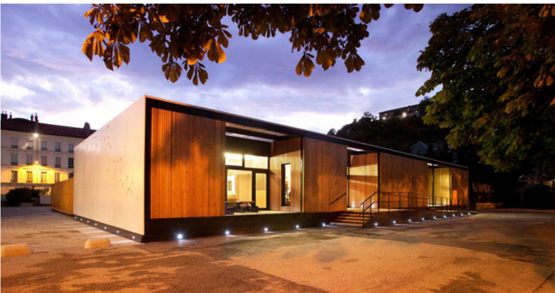
VUE SUR JARDIN DE VILLE PIGNON ET COURONNEMENT BETON BLANC - DUCTAL ET OSSATURE BOIS